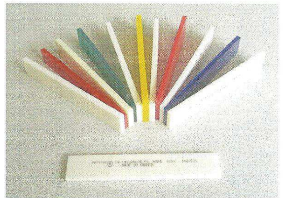
Racletas disponibles en doble y triple dureza también

Otras durezas son disponibles y se consideran como productos especiales